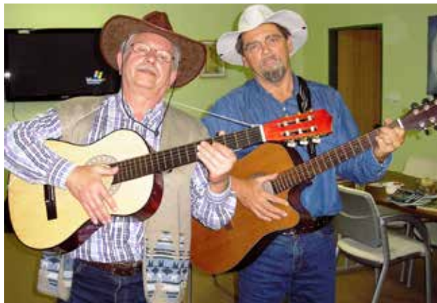
Den seniorů s kytarami, párky už jsou uvnitř

V jednom hitu 70.let se zpívalo „týden končí, víkend začíná“, když to oduševněle přebásníme na „září končí, podzim začíná“, znamená to přesun klubových akcí z terénu do tepla klubovny. Nicméně vycházky alespoň jeden čtvrtek v měsíci budou, abychom nezlenivěli a též omezili tvorbu tukových zásob na zimu, což jsme zdědili po lovcích mamutů.